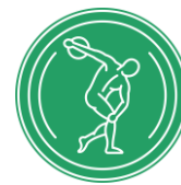
Tab. 2 Športové špecializácie ponúkané na FTVŠ UK